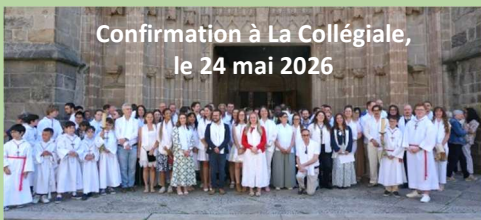
Confirmation à La Collégiale, le 24 mai 2026

Samedi 23 mai 2026, les confirmands du diocèse étaient invités à participer à une journée de recollection à la Maison diocésaine, à Saint-Étienne. Rencontres, temps de partage, démarches spirituelles à l'église de La Rivière (chants, chapelet...) et enseignements ont ponctué la matinée.