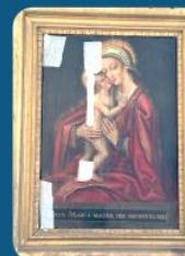
Vierge à l'enfant Hollandaise XVII

Aidez-nous à restaurer les tableaux de la Maison Saint-Joseph.