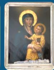
Vierge de Théotokos XIX

Ensemble redonnons une nouvelle jeunesse à ces œuvres anciennes.