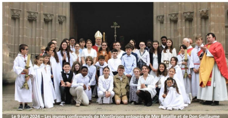
Le 9 juin 2024 – Les jeunes confirmands de Montbrison entourés de Mgr Bataille et de Don Guillaume