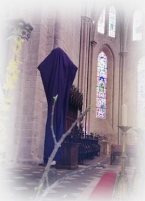
La croix voilée de la collégiale