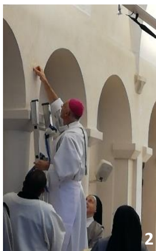
1. Scellement des reliques dans l'autel