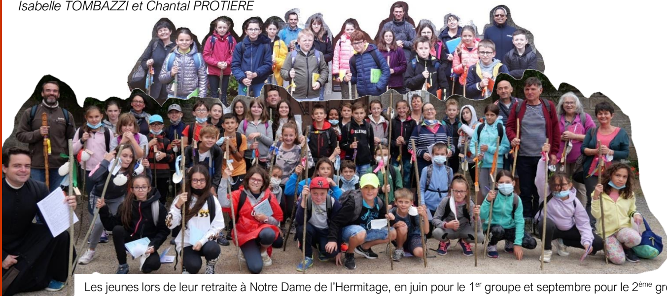
Les jeunes lors de leur retraite à Notre Dame de l'Hermitage, en juin pour le 1 er groupe et septembre pour le 2 ème groupe.